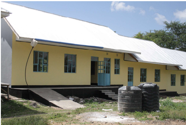
Liberty School Ansicht außen

Auch der Neubau der Liberty School macht sichtbare Fortschritte, wie uns auf den Bildern von Simon Croner vom August 2019 gezeigt wird. Zur Erinnerung: beim Dekanatskirchentag haben wir Geld gesammelt für das Dach dieser Schule. Nach der Reise der Delegation des Dekanats im Februar 2019 wurde beschlossen einen Betrag aus den Spendenrücklagen in Höhe von knapp 19.000 € für die Fertigstellung der Gebäude ins Partnerdekanat zu überweisen.